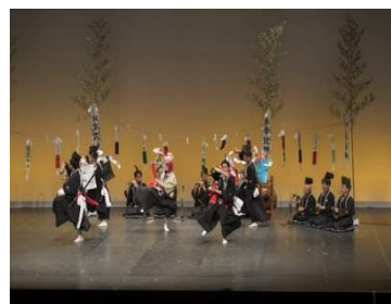
【措置 40】 地域伝統芸能全国大会の開催

山口鷺流狂言定期公演を開催しました（山口鷺流狂言保存会）。日時：令和4年11月12日。