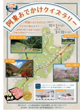
【措置11・12】 阿東ラリーイベント

長門峡を対象とした「長門峡ウォークラリー」、阿東地域の名勝等をめぐる「阿東おでかけクイズラリー」を開催しました。参加者330人、344人（文化財保護課）。