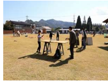
【措置 28】 築山跡史跡公園イベント

大路ロビーにおいて資料展示 3 回、築山跡史跡公園での遊び体験及び史跡巡りスタンプラリーのイベント 1 回をおこないました（文化財保護課）。