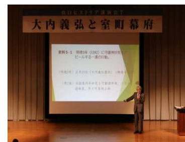
【措置7】 山口ヒストリア講演会7

山口ヒストリア講演会6「陶晴賢と厳島の戦い」、7「大内義弘と室町幕府」を開催しました。参加者203人、182人（文化交流課）。