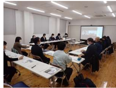
【措置 24】 推進会議の開催

長門峡名勝指定 100 周年記念事業の内容や、次年度の歴史文化資源の活用事業について山口市文化財保存活用推進会議で検討をおこないました（文化財保護課）。