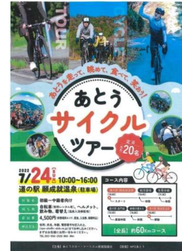
【措置 36】あとうサイクルツアーの開催

地域資源を活用した周遊促進を図るため、阿東地域ではサイクルツアー、徳地地域では歴史や農産物を活用したツアーをおこないました。南部地域の歴史・文化を活用した交流事業をおこないました（農山村づくり推進課）。