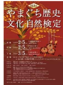
【措置 25】 やまぐち検定の実施

「おごおり検定」を実施し、10 名が参加されました（おごおり地域づくり協議会）。