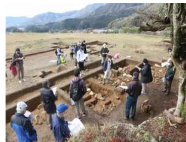
【措置6】 凌雲寺跡現地説明会

『山口市文化財年報16』と発掘調査報告書『史跡周防鋳銭司跡2』を刊行しました。史跡凌雲寺跡の発掘調査の現地説明会をおこないました（文化財保護課）。