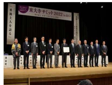
【措置 34】 東大寺サミットの開催

「東大寺サミット 2022 in 山口」を開催し、東大寺ゆかりの 15 自治体の首長が一堂に会して交流を深めました。参加者 550 人（徳地総合支所地域振興課）。