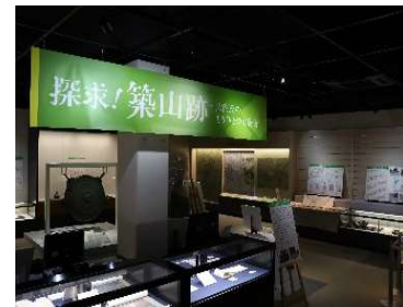
【措置 38】歴史民俗資料館の企画展