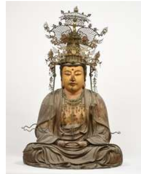
【措置14】 市指定文化財の指定