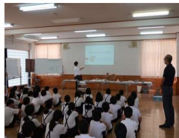
【措置47】 出前授業への派遣

小・中学校への出前授業・社会人向けの歴史講座・専門家向けの研修・歴史文化イベントなどに対し、文化財保護課職員を講師として派遣しました(文化財保護課)。