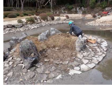
【措置 16】 常栄寺庭園整備工事

史跡大内氏遺跡附凌雲寺跡のうち築山跡及び高嶺城跡で樹木伐採をおこないました（文化財保護課）。