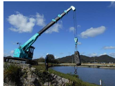
【措置 19】 名田島南蛮樋整備工事

史跡大内氏遺跡築山跡（隣接地含む）および史跡周防灘干拓遺跡名田島新開作南蛮樋の整備工事をおこないました。史跡周防銭司跡の保存活用計画の策定をおこないました（文化財保護課）。