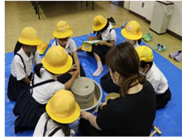
【措置13】 郷土学習の受け入れ