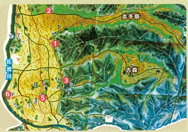
江戸時代中期の伊賀地の絵図