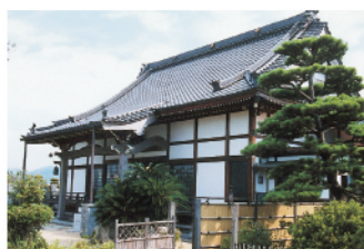
宝松寺/天正年間(1573~92)創建の宝積寺が貞享元年(1684)改宗して曹洞宗となり、明治5年大原長松寺を合併し、宝松寺となりました。