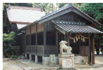
住吉神社/永仁2年(1294)摂津住吉神社より勧請して社殿が建てられ、航海の安全と和歌の神として敬われています。