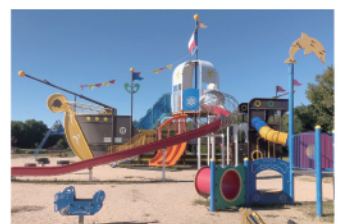
藤尾山/まんじゅう山と呼ばれる藤尾山の山すその海岸では水晶探しが楽しめました。山頂とふもとに藤尾山公園が整備されています。