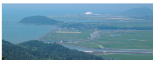
御伊勢山山頂(189.2m)/山頂からは、嘉川・興進地区はもとより周防大橋や阿知須干拓までが一望でき、晴れた日には国東半島も見ることができます。登山口は、山口市南部運動広場と原公会堂横にあり、どちらも約30分で山頂にたどり着きます。