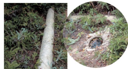
御伊勢山の鳥居/原登山道の山頂近くには解体された鳥居が横たわっています。安永4年(1775)6月と彫っており、江戸時代の「お伊勢参り」ブームに乗って祀られたものと思われます。