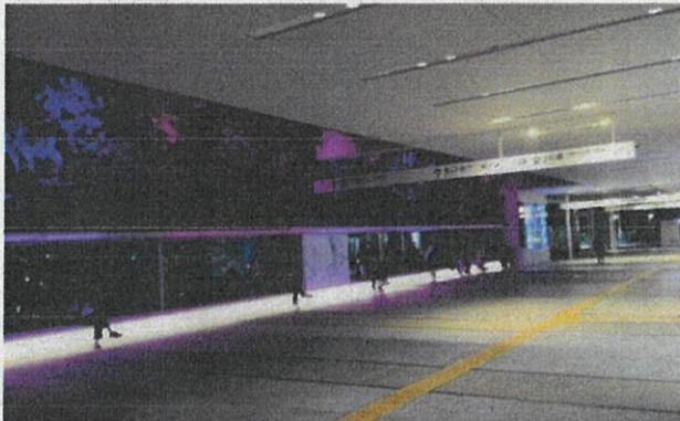
パープル・ライトアップ