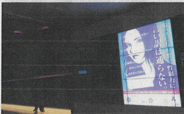
マルチディスプレイを 活用した啓発

担当：地域生活部人権推進課 男女共同参画推進室 直通934-2784 内線4004