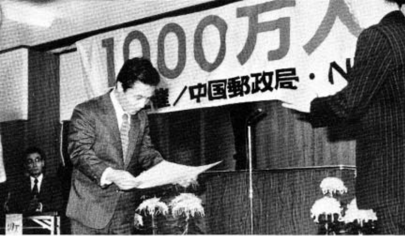
表彰状を受けとる木原製作所社長

実施後、表彰状、トロフィーの授与等が行われました。この様子は当日のニュースで放映されましたので、たくさんのかたにご覧いただいたことと思います。