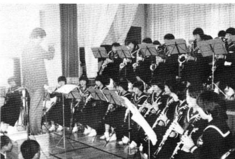
秋中ブラスバンド演奏