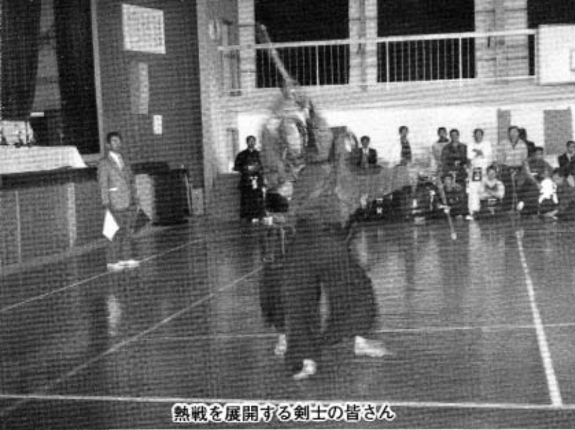
熱戦を展開する剣士の皆さん