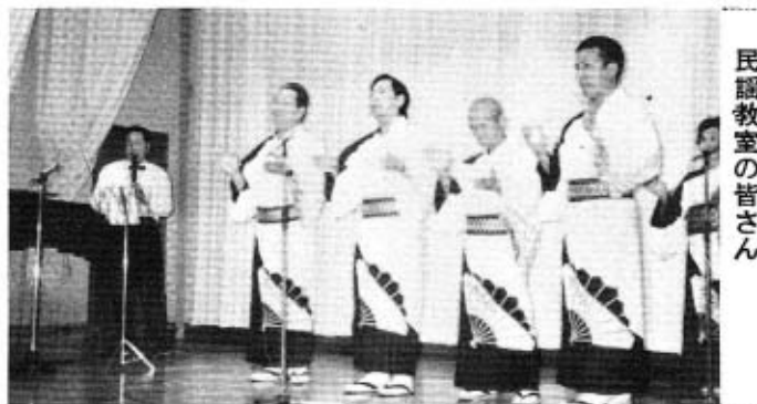
民謡教室の皆さん