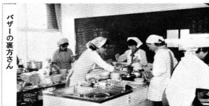
バザーの裏方さん

しめ飾りづくり (わら細工) 伝承教室 手づくりのしめ飾りで正月を迎えましょう。 秋穂伝承グループの皆さんのご指導で、しめ飾りづくりの講習会を次の要領で開催します。チビっ子の皆さんの多数の参加をお待ちします。 日時 十二月二十四日(秋穂、十二月二十五日(大海、午前十時から午後三時まで) 場所 秋穂(中央公民館 大海(大海分館) 昼食は各自持参してください。詳細については、子ども会育成会長さんにご連絡いたします。