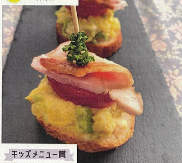
キッズメニュー賞