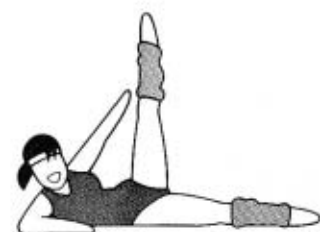
しなやか日本、みんなで行革。

◆ ◆ ◆ 年賀はがきは十二月二十日ま でにお出しく下さい。元旦にお 届けするためには、皆様のご協 力がが必要です。