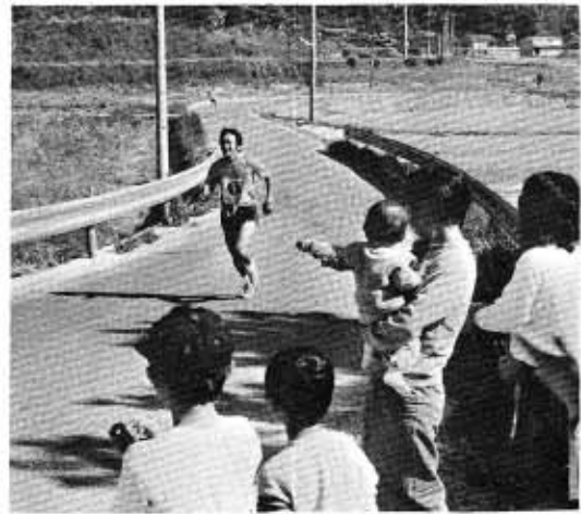
▶「頑張ってる」の声援に「ファイト」ももりもり