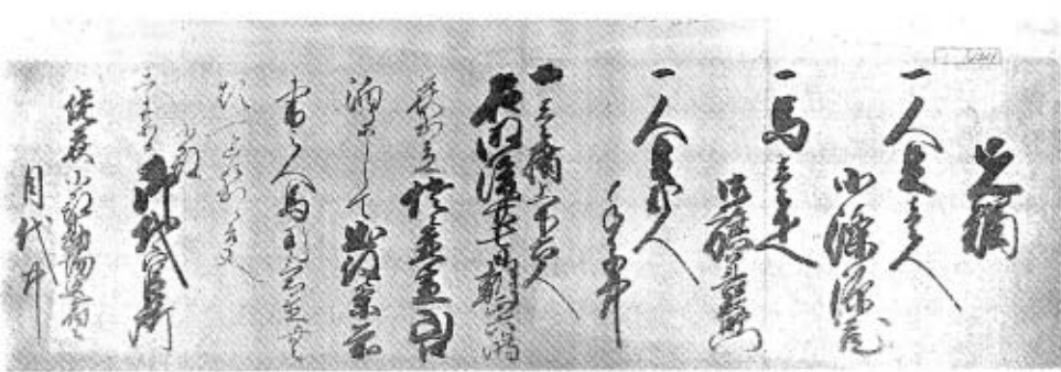
先触文書の一例(山内家文書より)

通りに触れておいたが、さらにこれから先五カ年間、これを続ける。天保十二年のことである。なお、佐々並、明木宿の規定の改正もあるが、ここでは省略する。 また、宿駅や小継所の人馬は常駐したのでなく、「先触」の予告があつてから服務を命じた。その先触文書の一例を山内家文書の中からここに掲げておく。 （中野・田中 種）