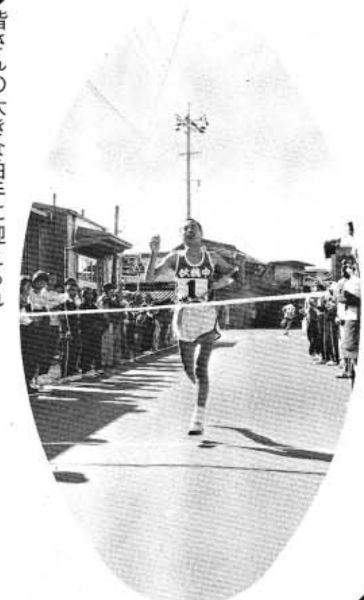
皆さんの大きな拍手に迎えられ「ゴールイン」