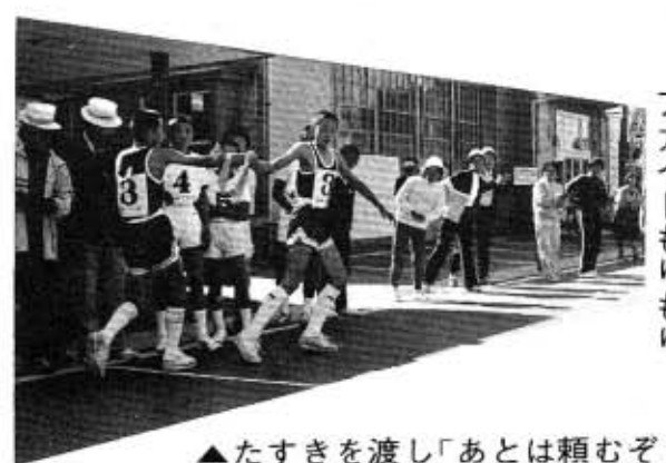
▲たすきを渡し「あとは頼むぞ」

十一月三日(文化の日)、長い間中止されていた「秋穂町一周駅伝大会」が秋穂町文化祭の協賛事業として復活され、盛大に実施されました。この大会には中学校五チーム、一般五チーム、オープン参加一チームが参加し、二十三・六キロの長丁場を沿道の声援を助みに健脚を競いました。大会の様子や区間賞に輝いた選手など、写真を中心に紹介します。