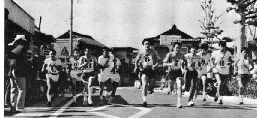
▶正午ちょうど 役場前を元気にスタート