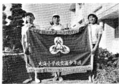
団旗を中心に役員の皆さん

この交通少年団は、交通事故が起きないように努め、安全な生活ができるようにすることを目的としています。児童の安全を守るためには、多くの皆さんの力が必要です。そのためには、少年団育成会を中心に、学校、家庭、地域ぐるみでの取り組みが不可欠です。 個人個人が、「運転は、気くばり目くばり、思いやり」でいつも交通安全に心がけましょう。