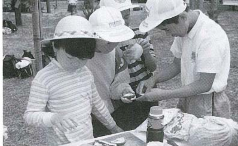
料理だって自分たちでします