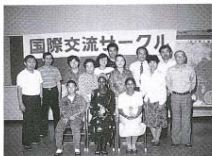
国際交流サークルの皆さん

研修生の皆さんは、七月十九日で研修を終え、二十日に帰国します。帰国まであとわずかですが、みんなのやさしい笑顔と暖かい心で、最後のいい思い出を作ってくてください。