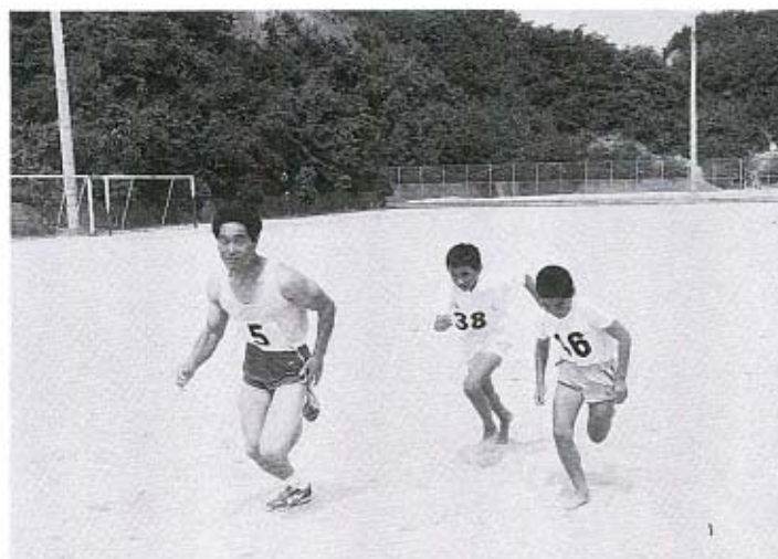
新記録を目指してダッシュ

六月三日(日)、第十一回町民陸上競技大会が、秋穂中学校グラウンドで行われました。今年は中学校が中間試験のため、中学