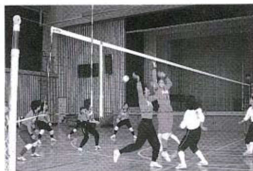
接戦が相次ぎました