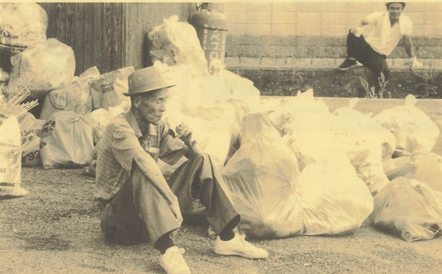
▲熱かった作戦は終了…。(小古郷公民館前)