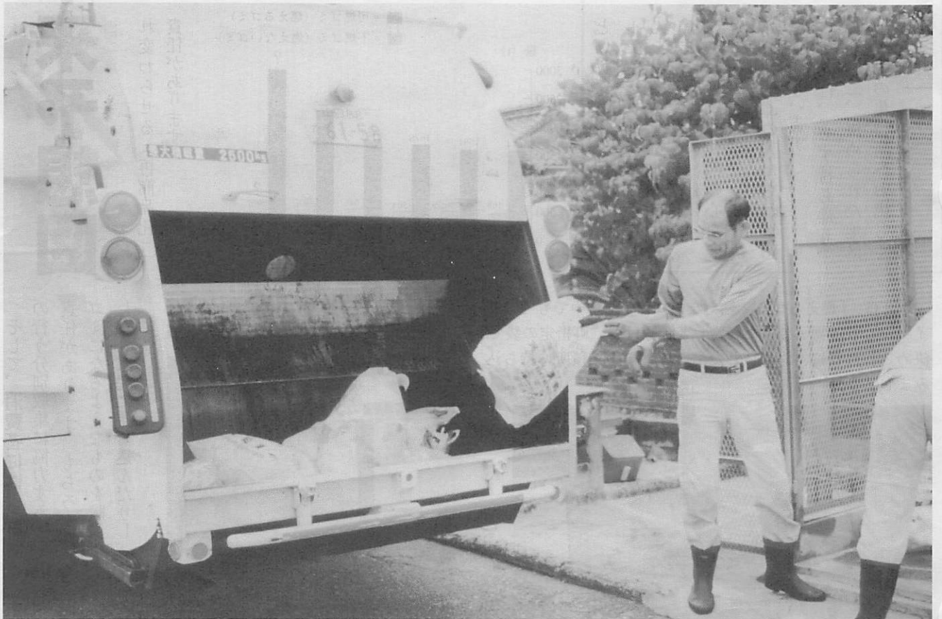
▲ 西条地区の集積所でゴミを回収する業者