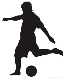
フットサルサッカー競技施設