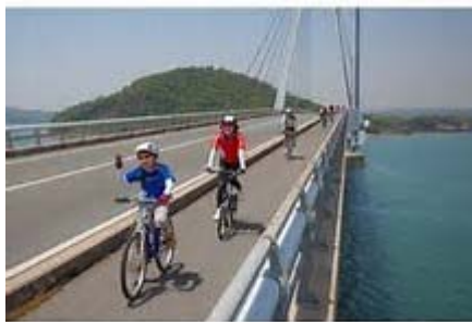
ツール・ド・山口湾

「ツール・ド・山口湾」や地域が主催する「マラソン大会」をはじめ、市内でスポーツ・ツーリズムが広がりを見せています。