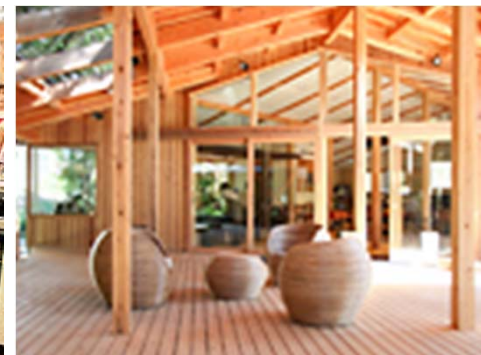
Cafe & Bar Mock オープンデッキ