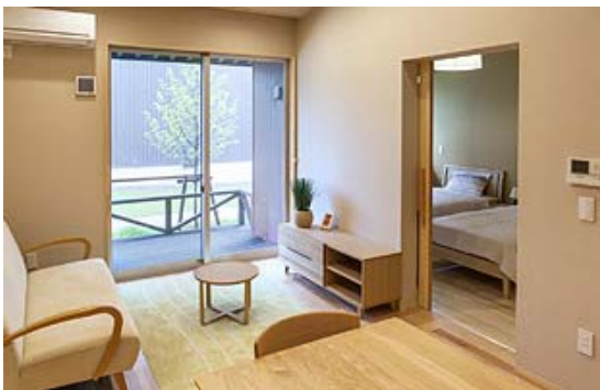
サービス付高齢者住宅