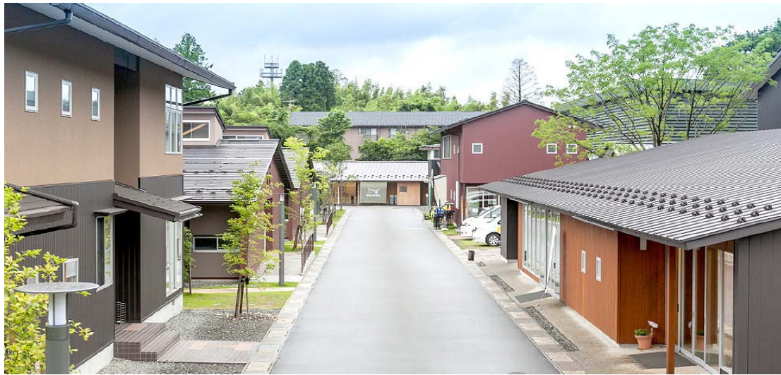
メインストリートを挟んで並ぶ住居(左)、とショップ(右)