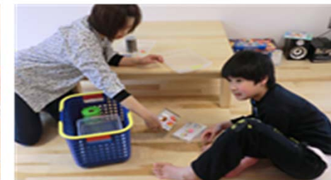
福祉児童入所施設