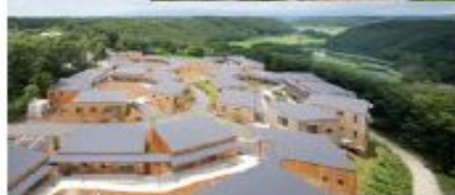
ゆいま～る那須の外観