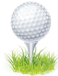
阿知須72カントリーをはじめとするゴルフ場