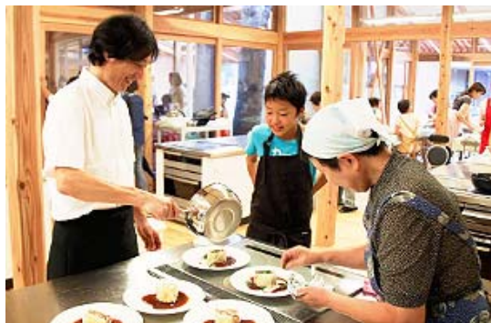
キッチンスタジオ