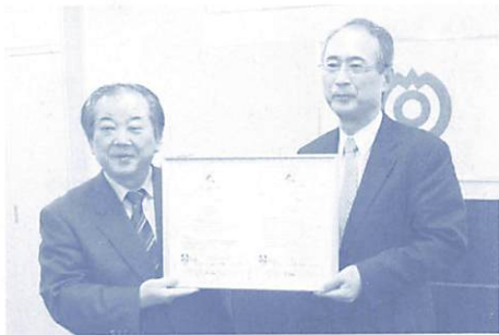
登録証授与式 昨年12月11日、審査登録機関の代表(右)から市長へ登録証が手渡されました。

平成19年9月の市長の「キックオフ宣言」により構築・運用を始めた市役所における環境配慮システムは、平成20年11月27日、国際標準規格「ISO14001」への適合を審査登録機関に認証されました。 これにより市には、世界に通用する環境配慮の仕組み(環境マネジメントシステム)が備わったこととなります。 今後、このシステムを活用した効果的な活動を進めるとともに、市民・事業者のみなさんへと活動を広げていきます。