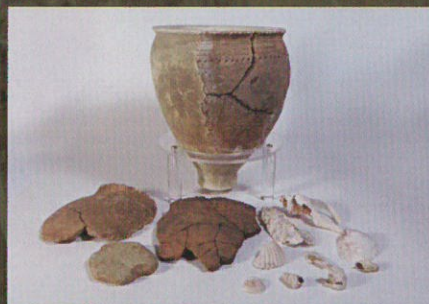
中郷遺跡出土 弥生土器 他

人々が土地を開拓し、日々の暮らしを営んでいた痕跡は、「遺跡」という形で地面の下に残されています。発掘調査の結果から、人々がどのように小郡の町をつくりあげていったかを紹介します。