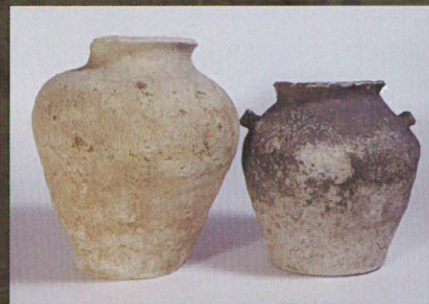
林覚遺跡出土 蔵骨器 ほか