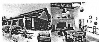
空き家に innovation。 リノベーションで移住、定住者を増やす。