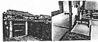
cot/コットからはじまる コミュニティの創造