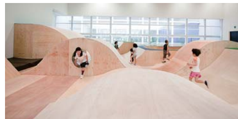
2012年の「コロガル公園」の様子

問い合わせ先／山口情報芸術センター[YCAM] ☎083-901-2222 FAX083-901-2217 ☎information@ycam.jp ☎ http://www.ycam.jp/events/2018/korogaru-koen-park-commons/