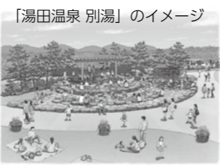
「湯田温泉 別湯」のイメージ

「健康の庭」の隣には「湯田温泉 別湯」(足湯)が登場。湯は毎日湯田温泉から4トンくみ上げてご提供します。さらに、湯田温泉初となる泉源を使ったふくの蒸し料理が販売され、歴史ある湯田温泉を五感で体感でき、まるで湯田温泉に來たような場を提供します。