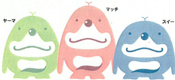
山口市移住・定住キャラクター 移獣スムスム

本事業は山口市にある空き家を優れた地域資源として活用し、新たな交流を創出することで、山口市の魅力を感じていただき、移住・定住の促進及び地域の活性化を図るものです。