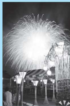
まがかで見られる!

佐波川の中洲から約1,500発の花火が夜空を彩ります。山に囲まれている会場では花火の破裂音が響き渡り、迫力ある花火が楽しめます。会場一帯に約240本の竹灯籠が並べられ、幻想的な雰囲気を醸し出します。