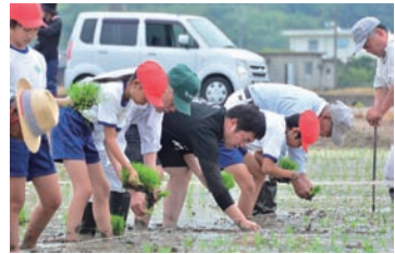
名田島小の児童や名田島老人クラブの皆さんと田植えを行った

も広がる名田島の穀倉地帯の色の変化には驚きました。移住してきた頃は、麦の苗が鮮やかな緑色でしたが、あつと言う間に黄金色に変わっていく様子を目の当たりにしたときは感動すら覚えました。それだけでなく、地域の方々の優しさ、野菜の新鮮さや美味しさなど、日々驚きと感動の連続です。今後の活動でも、このような魅力を発信していきたいです」と話されていました。