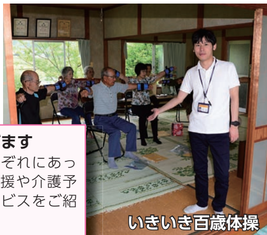
いきいき百歳体操

3 つなげます その人それぞれにあった、生活支援や介護予防等のサービスをご紹介します。