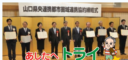
山口県央連携都市圏域連携協約締結式