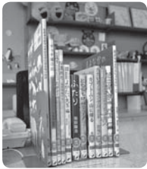
▲こどもカウンターと並んだ課題図書

このコーナーでは、図書館の利用方法や、お勧めの1冊をご紹介します。今月は、市立図書館の利用方法についてご案内します。