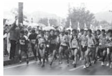
昨年の20kmの部 スタートの様子