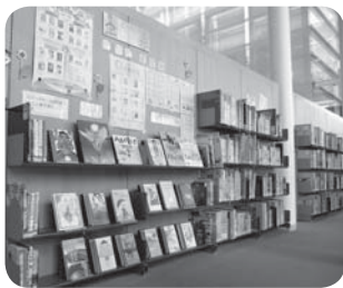
▲中央図書館の企画展示コーナー。過去の読書感想文や読書感想画の課題図書などを置いています。

夏休みは読書を楽しむ絶好の機会です。課題図書にとらわれず、自分が読んで好きになった本のことを書いてみるのもいいかもしれません。