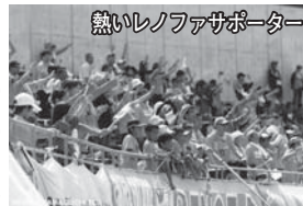
熱いレノファサポーター

いよいよJFLのセカンドステージが始まり、J3昇格に向けたレノファの戦いが繰り広げられています。ホームスタジアムでは、たくさんのサポーターに来ていただこうと、試合前やハーフタイムに趣向を凝らした企画が展開されています。会場に着いて、まず目にとまるのがフードコーナー。県内のB級グルメなどが集まっており、食も楽しめます。入場口では、大会プログラムが配られ、試合の見所などを詳しく解説。スタジアムに入ると、レノファサポーターと相手チームの熱い応援合戦が繰り広げられ、完全に異空間。ハーフタイムには、地元アイドルグループのライブやファン同士による結婚式など、毎試合趣向を凝らしたイベントが企画され、試合のみならず一日楽しめるイベント会場です。皆さんも、スタジアムでレノファを応援して、一緒にJ3を目指しましょう!