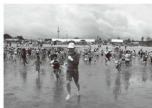
「暑い」夏に「熱い」思い出はいかがですか