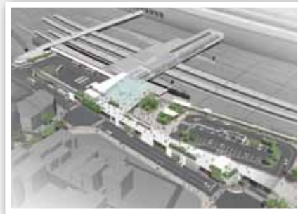
新山口駅北口駅前広場の整備イメージ