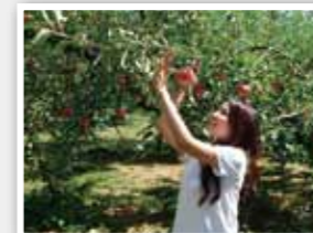
農業経営のモデルプラン化に携わる地域おこし協力隊

人口減少が進む地域を中心に、空き家バンク制度の確立を図ります。また、空き家バンク改修補助制度、家財等処分費補助制度を実施するとともに、不動産団体と連携して空き家の市場への流動性を高めます。