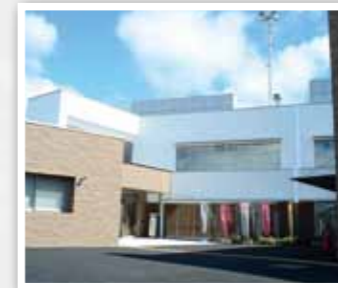
宮野地域交流センター

小郡、佐山、二島、銚銭司の各地域交流センターを建て替えるための建設工事や造成工事等を実施します。