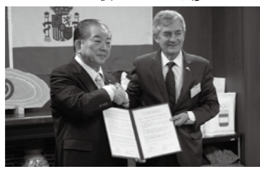
握手を交わす市長とカルペナ会長(右)

覚書には、事前キャンプだけでなく継続して交流に努め、多様な分野における相互の関係を更に発展させられるよう努めていくことも盛り込まれています。