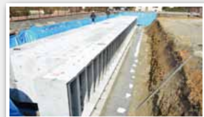
上東第二公園(吉敷)の横に設置される雨水貯留施設の工事の様子