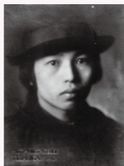
18歳の時の詩人 中原中也