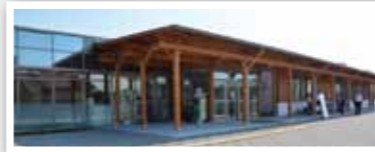
陶地域交流センター

徳地および阿知須地域交流センターの建て替えについては、総合支所との合築を基本に取り組みを進めます。供用開始は平成33年度を予定しています。