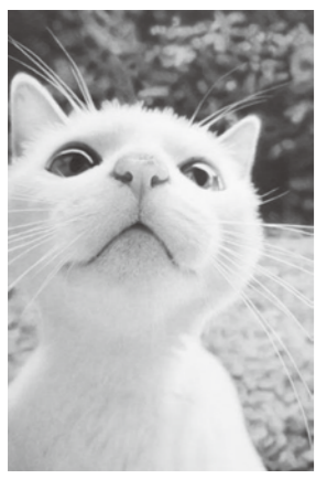
審査対象作品「リハビリ」