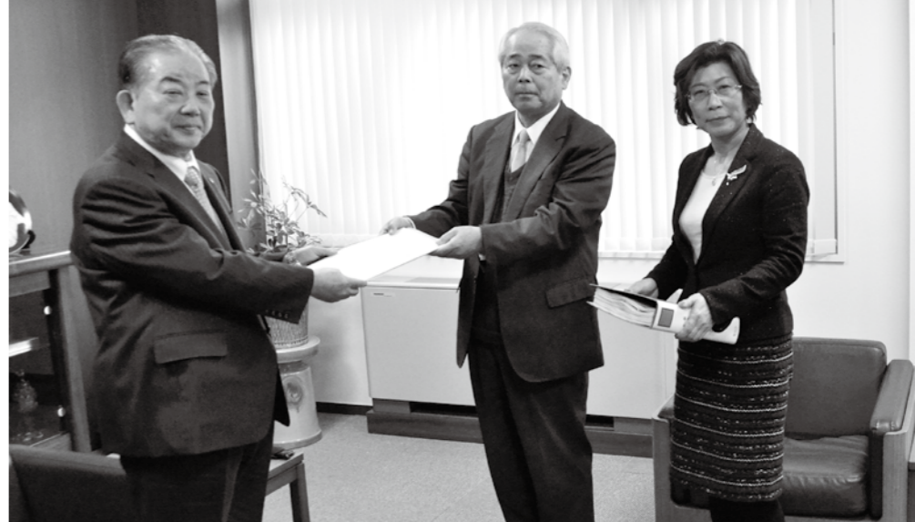
古賀会長から答申書を受け取る市長

1月20日、「山口市本庁舎の整備に関する検討委員会」の最後となる第7回会議が開催され、答申案がまとめられました。（概要は左下参照） このうち、候補地については、前回会議までに検討されていた公有地の候補地（3箇所5建設案）に、新山口駅周辺の民有地を追加することとされました。 なお、検討委員会の最終的な候補地の評価については、候補地①②「現在地と中央駐車場」と候補地②「亀山公園ふれあい広場」において最も高い評価とされました。