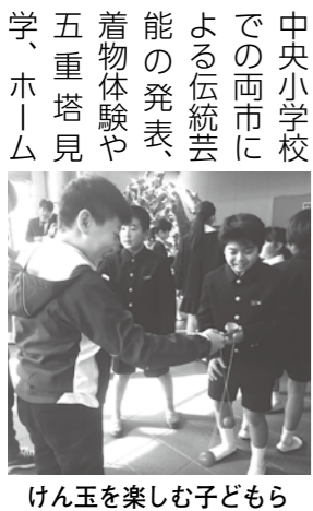
けん玉を楽しむ子どもら

1月17日、中国・山東省済南市の「済南市青少年交流訪問団」が、市長表敬のため市役所に来られました。訪問団の16人は5日間の滞在で、