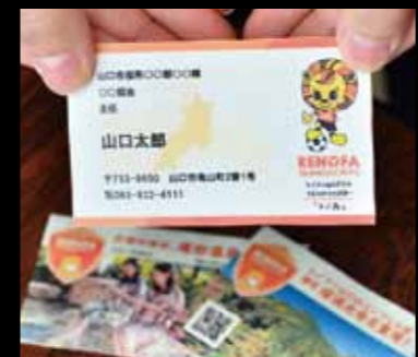
市では職員にシティセールスの一環としてレノファがデザインされた名刺で山口市をPRするよう呼びかけている。

市立図書館では、選手とのコラボレーション企画や、ユニフォームの展示を予定している。「図書館によく行くがレノファに関心が無い」「レノファのファンであるが図書館には