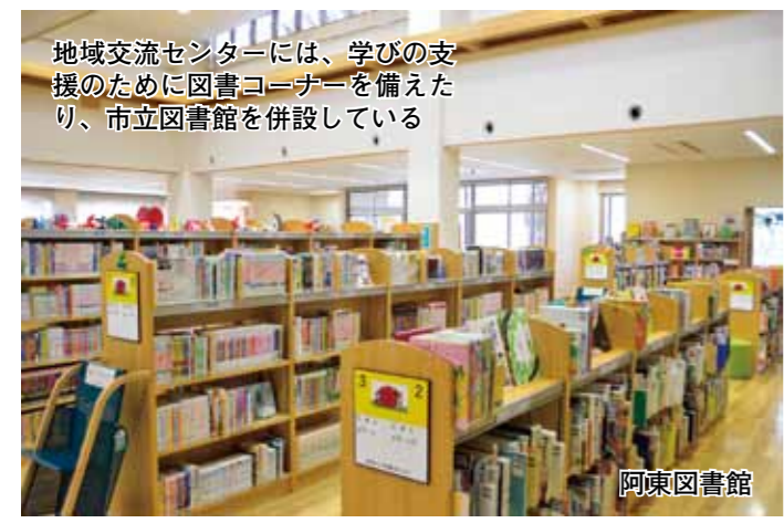
地域交流センターには、学びの支援のために図書コーナーを備えたり、市立図書館を併設している

ンター講座を契機として、地域の人が知り合ったり、サークルを立ち上げることで、地域交流センターを定期的に利用することにつながって欲しいと考えています。 センター講座の参加費は、比較的リーズナブルに抑えられているものがほとんどです。例えば、どこの地域交流センターでも人気の講座である料理教室は、材料費の実費のみで参加できたりします。また、託児サービスを用意し、子育て世代のお母さんにも参加しやすい取り組みをしているところもあります。興味があるセンター講座を見つけ、是非一度参加してみてください。