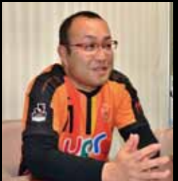
選米守守の「選手、迷います」と「選手、迷います」と話した。

持って他県にまで車で応援に行くほどの熱の入れようだ。「ゴール裏は試合がよく見えないが選手と一緒に戦って戦って、良いストレス発散になっている。選手がゴールを決めて自分