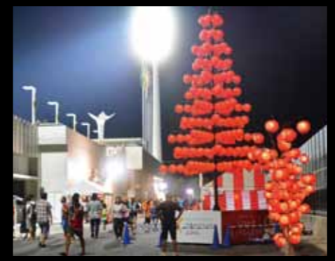
昨年8月21日に本市が協賛した試合会場周辺の様子。ちょうちんツリーを設置して、本市のちょうちん祭りをPRした。

平成27年から、ふるさと納税「ふるさとやまぐち寄附金」の返礼品として、レノファのユニフォームや観戦チケットを新設した。平成28年は、レノファ関連だけで1694万5千円（391件）ものご寄付があった。好評につき今年も準備しており、現在はシーズンチケットが人気を集めている。自分以外の人も送付先を指定できるので、他市に住む大切な方へのプレゼントなどに利用してみたいかがだろうか。ふるさと納税はウェブサイトで受け付けるほか、ふるさと産業振興課でも受け付けている。