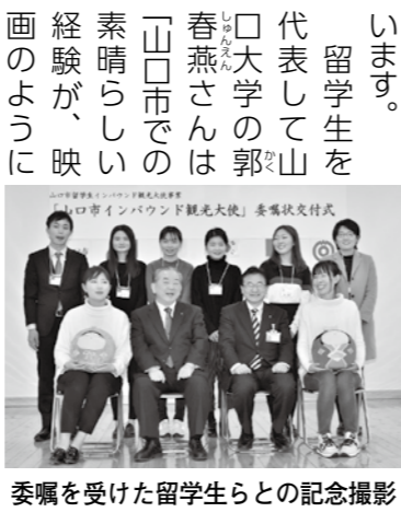
委嘱を受けた留学生らとの記念撮影

1月20日、山口総合支所で留学生9人に「山口市留学生インバウンド観光大使」を委嘱しました。 この事業は、本市を中心とした観光素材を体感してもらい、帰国後に山口の魅力を発信してもらうことを目的として平成22年度から実施して