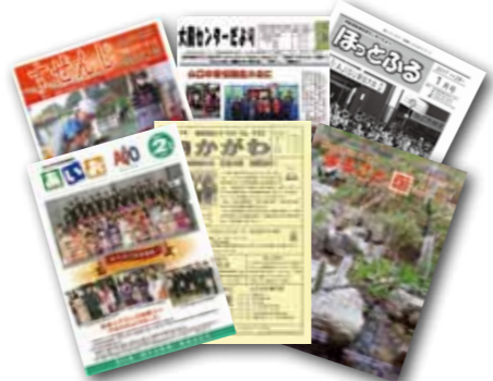
ウェブサイトでも閲覧できる地域交流センターだよりもある

地域交流センターで開催される講座や生涯学習関連のサークルの情報は、市報と一緒に配布される地域の広報紙、通称「地域交流センターだより」で知ることが出来ます。また、ウェブサイト「Y-book」など、お住まいの地域以外でも見ることが出来ます。地域外の住民でも参加できる講座やイベントもたくさんありますので、是非ご覧になってください。