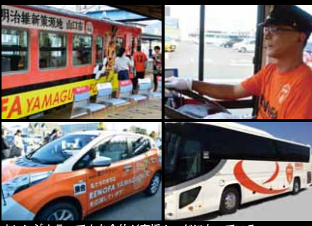
オレンジカラーでまち全体が応援ムードになっている